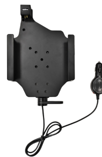
V-Dock 带点烟器插头 电源适配器